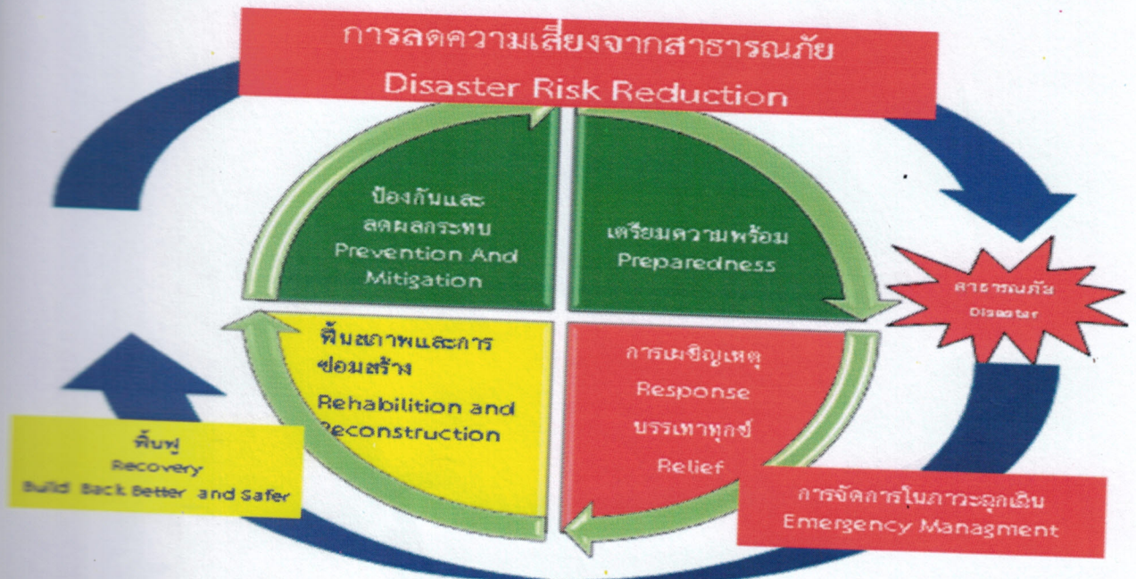
แผนภาพที่ ๑-๑ : วงจรการจัดการความเสี่ยงจากสาธารณภัย

องค์การบริหารส่วนตำบลเกาะสาหร่าย มีหน้าที่ในการป้องกันและบรรเทาสาธารณภัยในเขตท้องถิ่น โดยมีผู้บริหารท้องถิ่นเป็นผู้รับผิดชอบในฐานะผู้อำนวยการท้องถิ่น และมีปลัดองค์กรปกครองส่วนท้องถิ่น เป็นผู้ช่วยผู้อำนวยการท้องถิ่น รับผิดชอบและปฏิบัติหน้าที่ในการป้องกันและบรรเทาสาธารณภัยในเขตท้องถิ่น และช่วยเหลือผู้อำนวยการจังหวัดและผู้อำนวยการอำเภอตามที่ได้รับมอบหมาย องค์การบริหารส่วนตำบลเกาะสาหร่าย จึงต้องมีการเตรียมพร้อมและรับมือกับสถานการณ์สาธารณภัยต่างๆ ที่อาจเกิดขึ้นได้ตลอดเวลา จึงได้จัดทำแผนปฏิบัติการในการป้องกันและบรรเทาสาธารณภัยของ องค์การบริหารส่วนตำบลเกาะสาหร่าย พ.ศ. ๒๕๖๐ ขึ้น ซึ่งเป็นไปตามพระราชบัญญัติป้องกันและบรรเทาสาธารณภัย พ.ศ. ๒๕๕๐ และสอดคล้องกับแผนการป้องกันและบรรเทาสาธารณภัยแห่งชาติ พ.ศ. ๒๕๕๘ รวมทั้งมีความเชื่อมโยงกับยุทธศาสตร์การเตรียมพร้อมแห่งชาติ และแผนการป้องกันและบรรเทาสาธารณภัยจังหวัด/อำเภอ เพื่อให้การบริหารจัดการสาธารณภัยเป็นไปในทิศทางเดียวกันทั้งระบบ และเพื่อประโยชน์ในการป้องกันและบรรเทาสาธารณภัยได้อย่างรวดเร็วและมีประสิทธิภาพ สร้างความเชื่อมั่นให้กับประชาชน และสร้างพื้นที่ให้เป็นท้องถิ่นที่ปลอดภัย โดยให้ความสำคัญกับหลักการจัดการความเสี่ยงจากสาธารณภัยที่ประกอบด้วยการลดความเสี่ยงจากสาธารณภัย ได้แก่ การป้องกัน การลดผลกระทบ และการเตรียมความพร้อม ควบคู่กับการจัดการในภาวะฉุกเฉิน ได้แก่ การเผชิญเหตุ และการบรรเทาทุกข์ รวมทั้งการฟื้นฟู ได้แก่ การฟื้นฟูสภาพและการซ่อมสร้าง การสร้างใหม่ให้ดีกว่าและปลอดภัยกว่าเดิม ตามวงจรการจัดการความเสี่ยงจากสาธารณภัย (แผนภาพที่ ๑ - ๑)